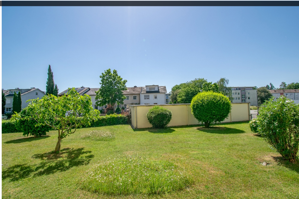
BLICK BALKON —————